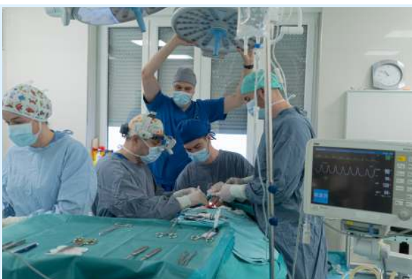
Operativni zahvat, sala 2

Od 2016. godine u KBC-u Osijek ustrojen je višedisciplinarni tim za tumore glave i vrata Kliničkog bolničkog centra Osijek u cilju podizanja kvalitete liječenja onkoloških pacijenata s područja pet slavonskih županija i šire. Taj tim uključuje specijaliste iz područja onkologije, radiologije, plastične i rekonstruktivne kirurgije, dermatologije, patologije, maksilofacijalne kirurgije te otorinolaringologije i kirurgije glave i vrata. Redoviti sastanci višedisciplinarnog tima održavaju se u svrhu postizanja zajedničkog konsenzusa specijalista iz više medicinskih područja radi učinkovitog, kvalitetnog i brzog odabira optimalnog liječenja pacijenata s malignim oboljenjima u području glave i vrata.