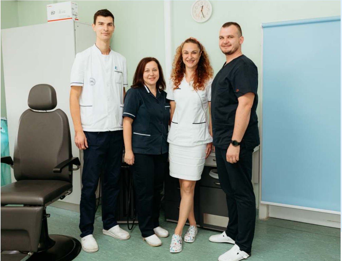
Glavne medicinske sestre i tehničari Klinike