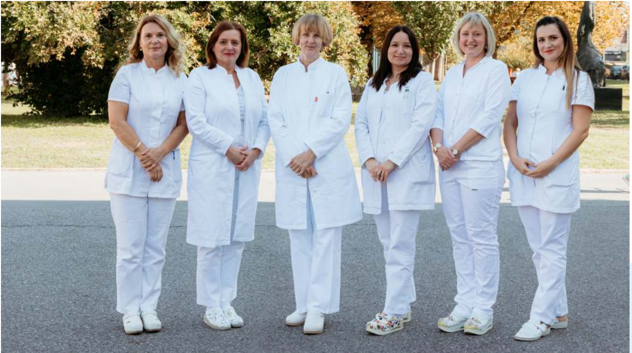
Liječnice Zavoda za audiologiju i fonijatriju