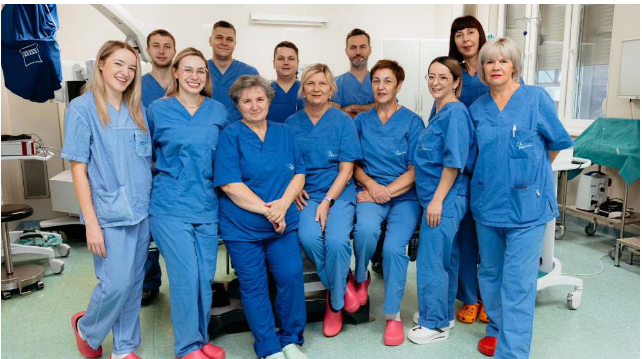
Djelatnici ORL operacijskog bloka