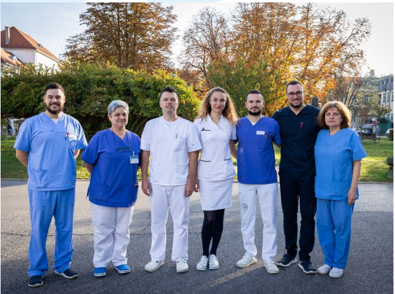
Djelatnici Zavoda za otorinolaringologiju i kirurgije glave i vrata