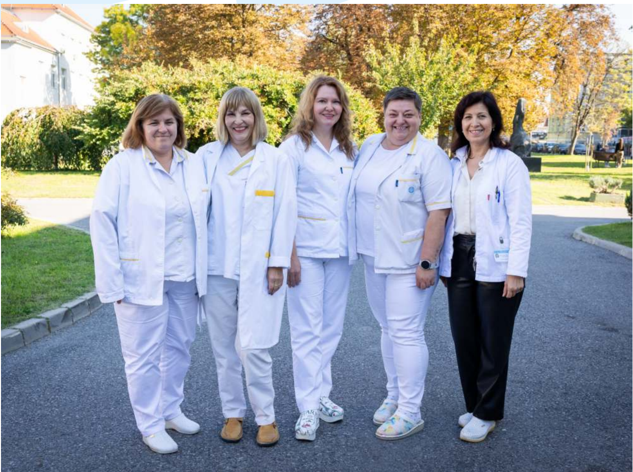
Tajnica Klinike s referenticama