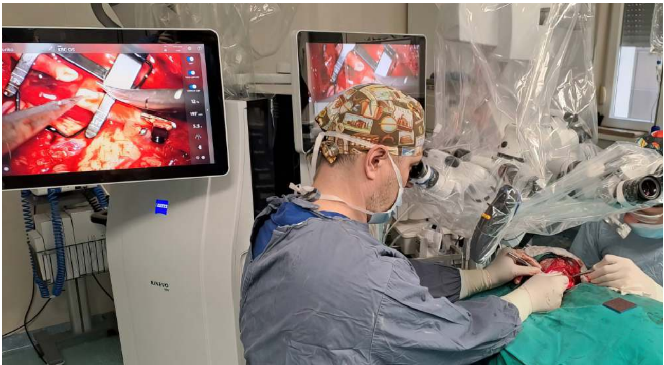
Spajanje mikrovaskularnih anastomoza