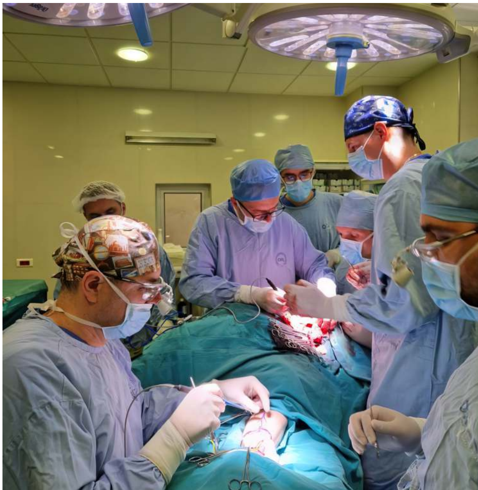
Dva tima liječnika izvode onkikirurški zahvat

Osim edukacije i istraživanja, Klinika će se usmjeriti i na modernizaciju infrastrukture te uvođenje novih tehnologija u svakodnevni rad. Investicije u naprednu medicinsku opremu omogućit će preciznije dijagnostičke postupke, minimalno invazivne operacijske zahvate i bolje poslijeoperacijske rezultate. Uvođenjem novih tehnoloških rješenja, poput robotizirane kirurgije i naprednih sustava za navigaciju tijekom operacija, Klinika će osigurati da njezini pacijenti dobiju najsuvremeniju medicinsku skrb.