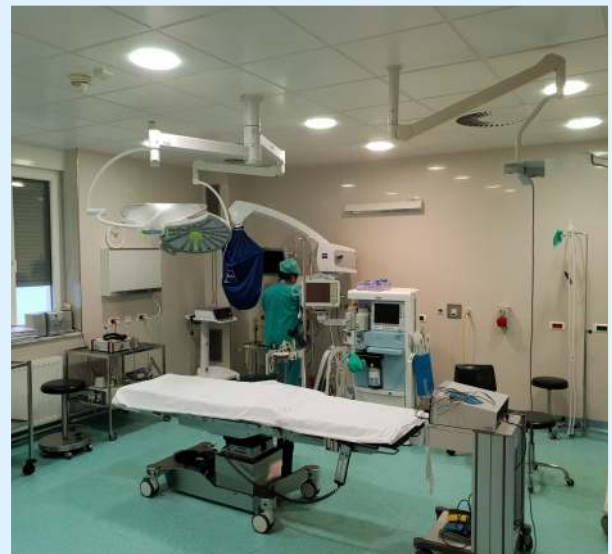
Sala u ORL operacijskom bloku

Osim višedisciplinarnog tima za tumore glave i vrata, Klinika za otorinolaringologiju i kirurgiju glave i vrata ima dugogodišnju suradnju s Centrom za bolesti štitnjače Kliničkog bolničkog centra Osijek. Naime, zajedničko prezentiranje složenih slučajeva iz područja kirurgije štitnjače i paratireoidnih žlijezda te odluka o najoptimalnijem obliku liječenja za pacijente održava se redovito u prostorijama Klinike za otorinolaringologiju i kirurgiju glave i vrata.