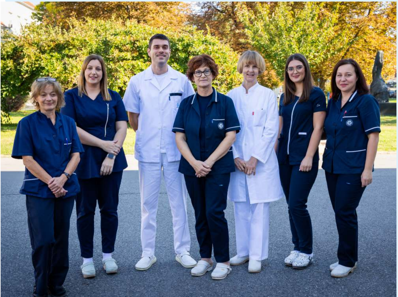
Djelatnici Zavoda za audiologiju i fonijatriju