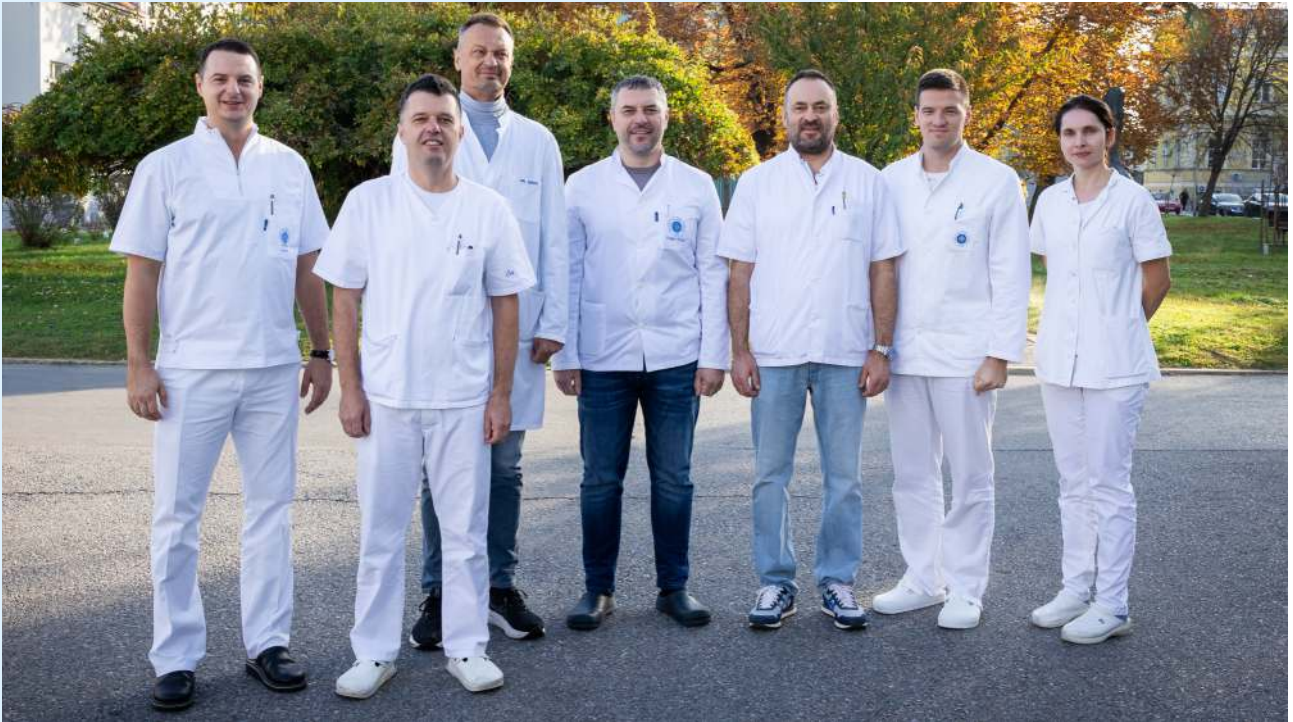
Liječnici Zavoda za otorinolaringologiju i kirurgije glave i vrata