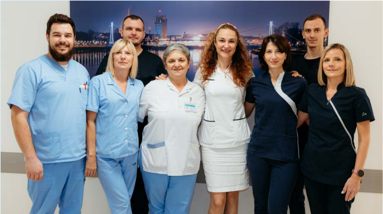
Djelatnici ORL stacionara